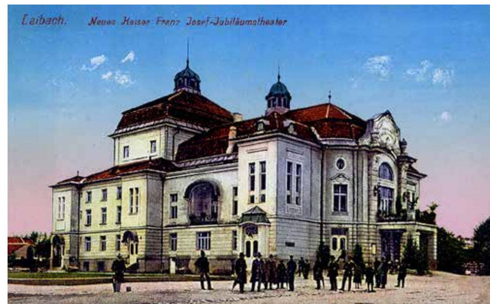
Jubilejno gledališče cesarja Franca Jožefa, ki so ljubljanski Nemci postavili l. 1911; po prvi vojni z imenom »Ljubljana – dramsko gledališče«, pridruženo Slovenskemu gledališču, pozneje preimenovano v SNG Drama Ljubljana.

time, which was also a premiere in the Franz Joseph Jubilee Theatre, today's Drama Ljubljana; the nationalisation of theatre in the new state, the Kingdom of Serbs, Croats and Slovenes, which provided Slovenian theatre for the first time in its history solid funding based on social consensus; and Cankar's dramas, which after the writer's death in 1918 were welcomed on Slovenian stages. Considered retrospectively, in 1920 with the end of professionalization and the beginning of the Europeanisation era of the Slovenian theatre, the contribution of the Drama Society in its half a century of existence becomes a lot more evident.