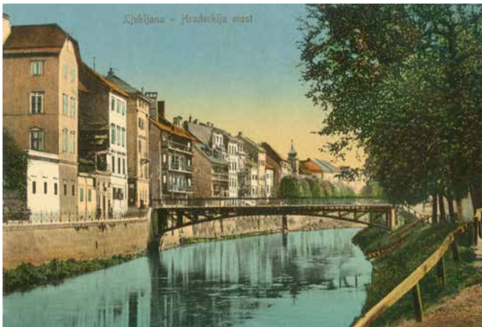
Čevljarski most v Ljubljani v času snovanja Dramatičnega društva, fotografija iz l. 1867.