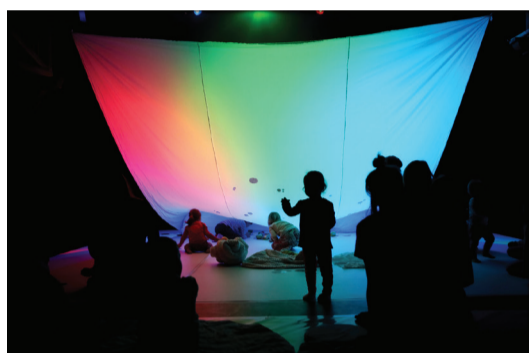
Rumena pika na nebu (1-5 let), Zavod Odprti predali

Kdo so malčki, predšolski otroci, kdo otroci v zgodnjem, srednjem in poznem otroštvu in kdo mladostniki? O čem razmišljajo? Čemu se smeji? Kakšna mora biti predstava, da jih pritegne?