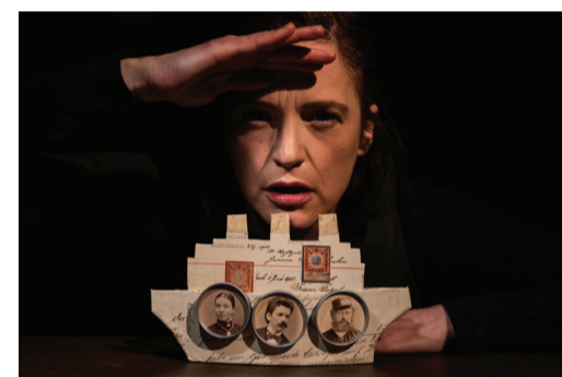
Alma (12+), Lutkovno gledališče Maribor

Udeležba je brezplačna, obvezna prijava.