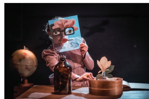
Palčica (4-9 let), Lutkovno gledališče Ljubljana

Na delavnici se bomo posvetili prav temu: kako s pomočjo spoznanj razvojne psihologije narediti uprizoritev, ki bo resnično namenjena izbrani ciljni publiki in bo polno zaživela v dvorani. Potekala bo kot preplet predstavitev, pogovorov in dela v skupinah s pristopi gledališke pedagogike.