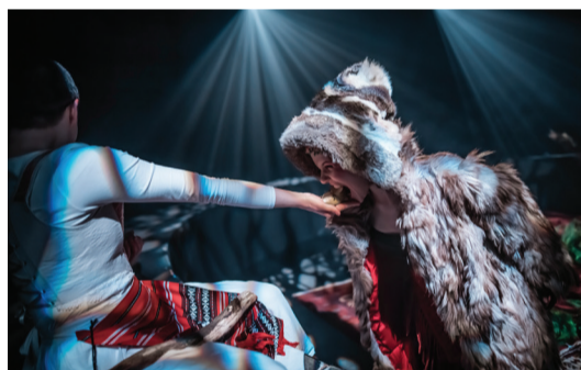
Gorjanci (10-13 let), Zavod Margareta Schwarzwald, CD

Razvojna psihologija raziskuje razvojna obdobja , v katerih otrok raste in se razvija na vseh pomembnih področjih. V vsakem obdobju prepoznavamo določene značilnosti, ki se smiselno povezujejo z elementi uprizoritvene umetnosti. Zagotovo je največja želja ustvarjalcev predstava, ki učinkovito komunicira z mladimi gledalci , ki jih nagovori in pritegne, ki jo razumejo in polno doživijo. Zato je dobro poznati osnovne razvojne značilnosti posameznih starostnih skupin in temu prilagoditi uprizoritveni pristop in gledališki jezik .