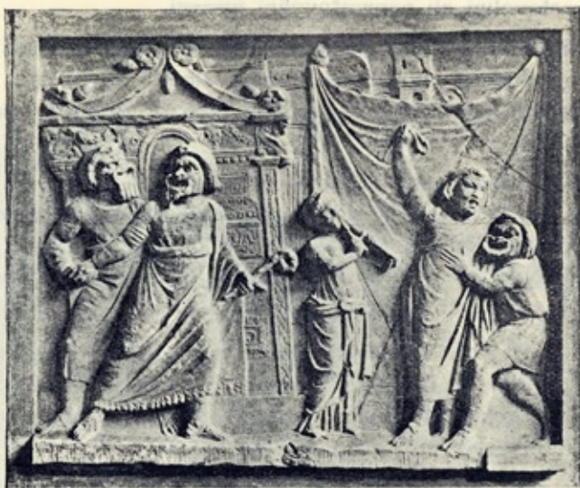
Značilen prizor iz antične komedije.

Leta 534. ali 536. p. Kr. je upeljal Athenec Thespis novost, ki je bila za razvoj grške drame velikanskega pomena; na čelo zbora je postavil namesto prejšnjega zborovodje — pevca, moža, ki ni več pel, marveč odgovarjal v nevezani besedi, to se pravi, opravljal je vlogo igravca. Naravnost neverjetno se zdi, kakšen silen preobrat je nastal zavoljo te dozdevno preproste izpremembe. Odprlo se je neizmerno bogastvo najrazličnejših možnosti, tako glede vsebine, kakor glede sproščenosti dejanja. Namesto enakomernega zborovskega petja je zavihralo bujno, dramatično dejanje. Začela se je za dramo čisto nova doba v dramaturškem postopku, zlasti še, ker so bile uvedene platnene maske, s katerimi je mogel igravec zakriti svoj obraz, s čimer mu je bilo omogočeno igrati različne osebe v drami. Tega igravca je postavil Thespis na preprost, iz navadnih desk zbit oder, v čimer moremo — po dosedanjih dognanjih — opravičeno gledati prvi in pravi začetek odra v današnjem smislu.